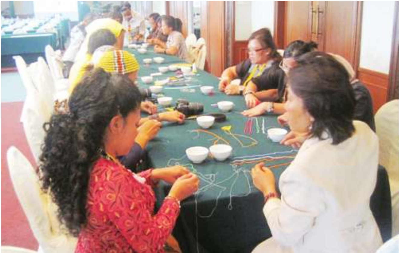
► BENGKEL perhiasan manik sedang dijalankan oleh peserta seminar. Participants trying their hands at beads decoration during the workshop.