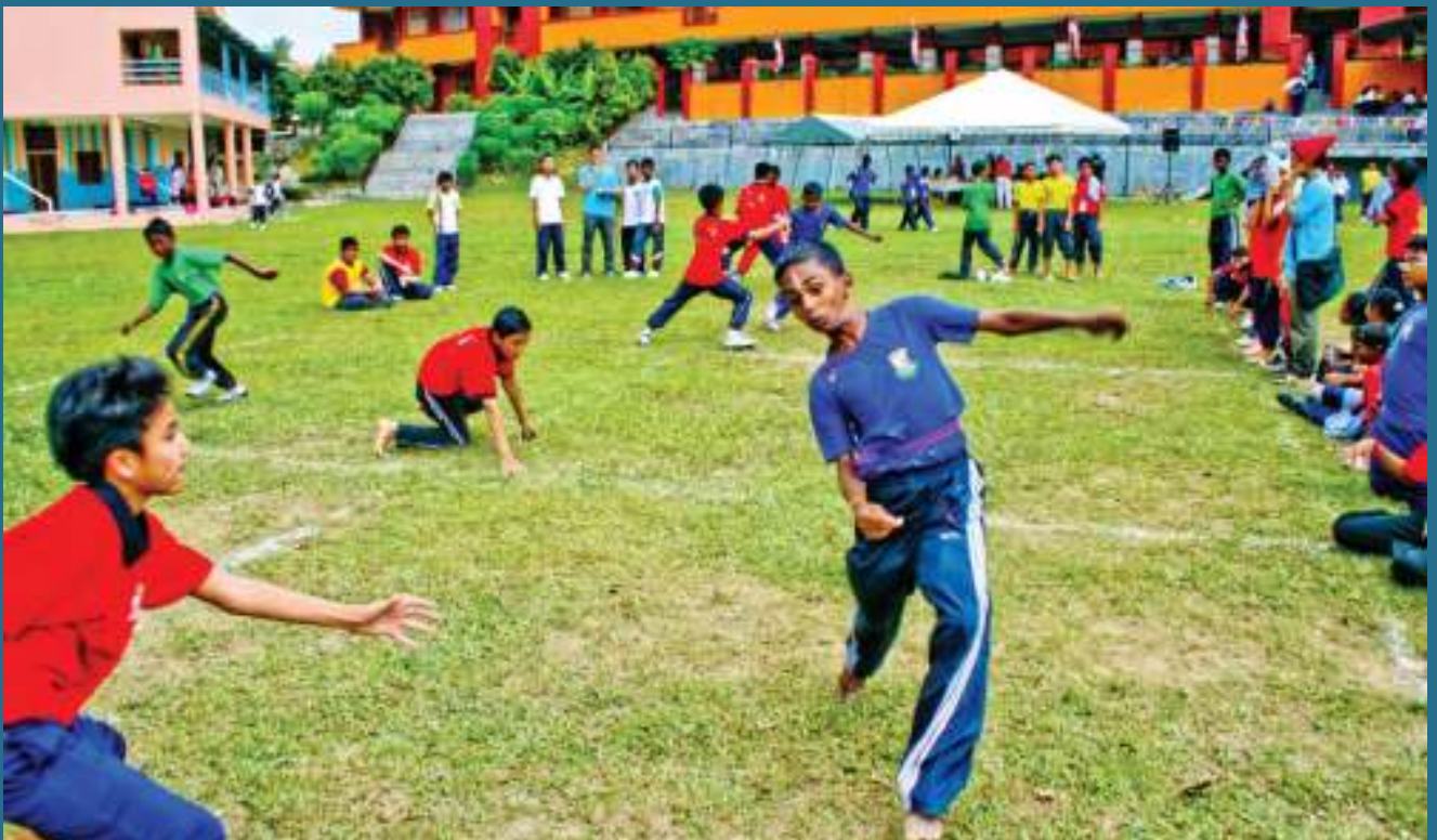
PESERTA Permainan Tradisional 1Malaysia dalam permainan Galah Panjang.