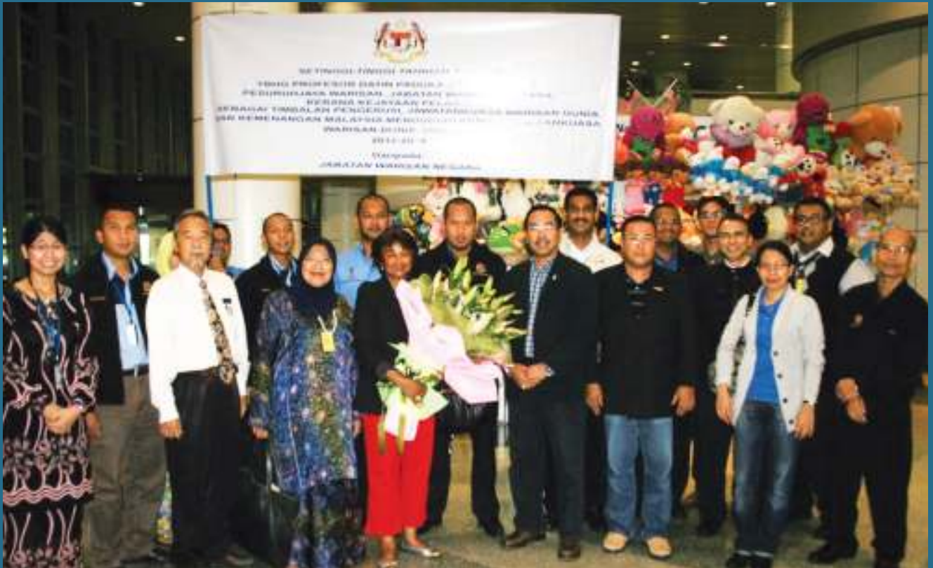
STAF JWN menyambut kepulangan Ketua Pengarah JWN dan rombongan yang telah berjaya mengharumkan nama negara di persada dunia.