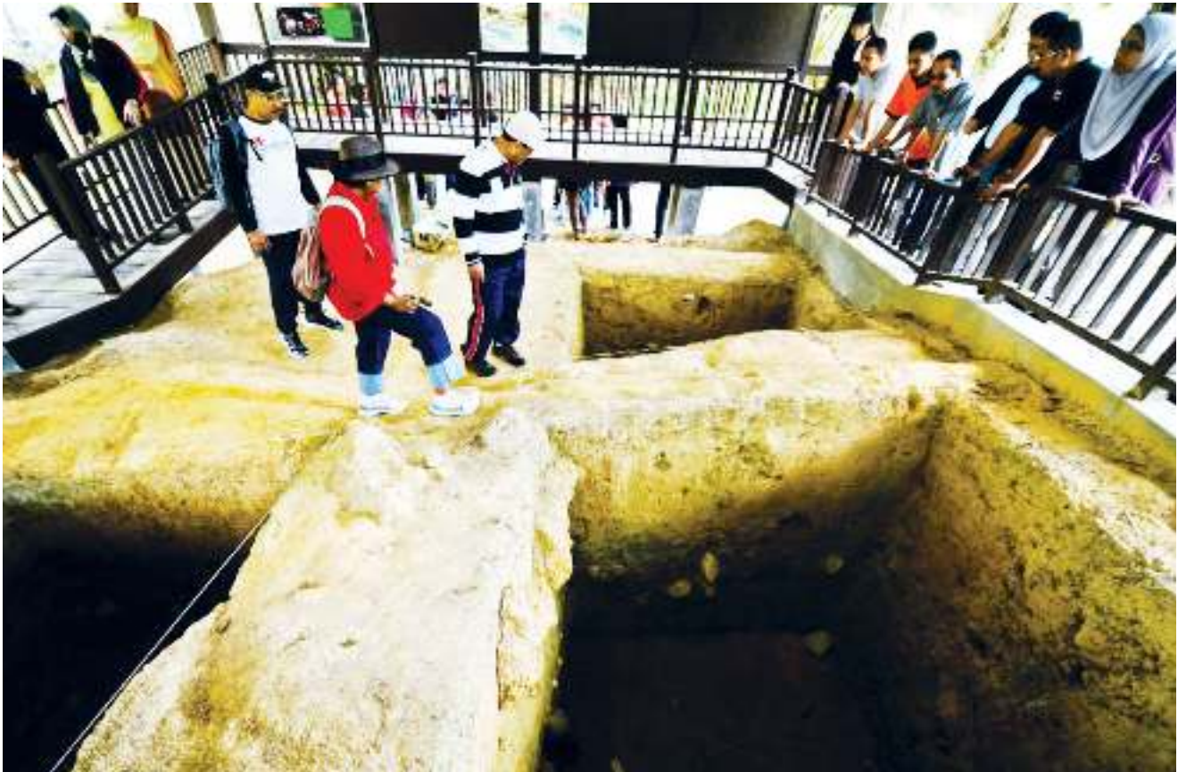
► TIMBALAN Ketua Setiausaha (Kebudayaan) melawat tapak arkeologi Kota Tampan. The Deputy Secretary-General (Culture) visiting the archaeological site of Kota Tampan.