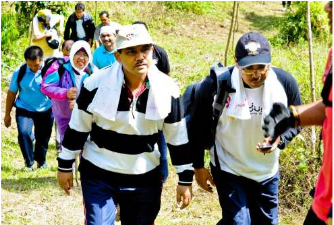
► BERTENAGA... TKSU (K) bersama staf JWN mendaki Gua Gunung Runtuh. Deputy Secretary-General together with Department of National Heritage's staff climbing up to the Gua Gunung Runtuh

Di akhir lawatan, taklimat pengenalan kepada Jabatan Warisan Negara telah disampaikan bagi memberi gambaran tentang tugas dan peranan utama JWN secara keseluruhannya. TKSU (K) telah mengucapkan tahniah dan terima kasih atas usaha JWN melaksanakan program ini. Beliau juga berharap agar Lembah Lenggong berjaya diiktiraf sebagai Tapak Warisan Dunia UNESCO pada keputusan yang dijangka akan diumumkan pada bulan Julai 2012.