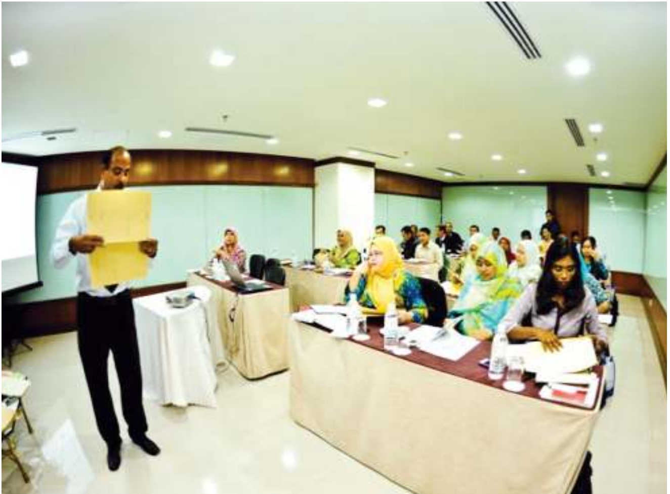
▶ SESI ceramah dan pembelajaran di dalam kelas yang disampaikan oleh penceramah dari Maktab Polis Diraja Malaysia Kuala Lumpur. Class lectures and study sessions conducted by speakers from the Royal Malaysia Police College of Kuala Lumpur.