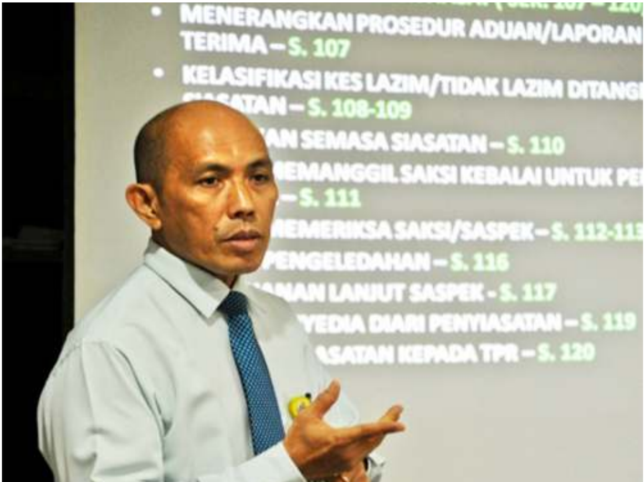
► PENCERAMAH menyampaikan taklimat pada bengkel tersebut. The speaker delivering his talk during the course.