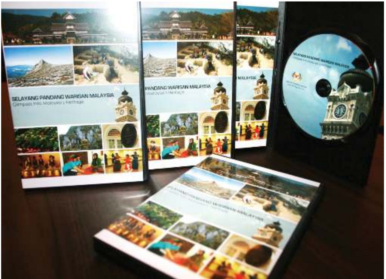
► DOKUMENTARI Selayang Pandang Warisan Malaysia. Glimpses Into Malaysia's Heritage documentary.