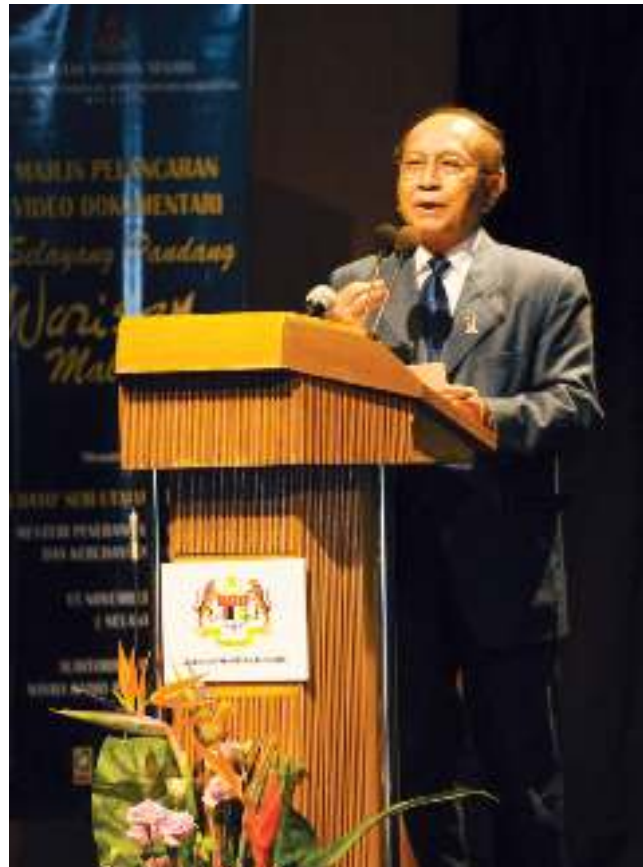
► YB Menteri KPKK memberi ucapan pada Majlis Pelancaran Dokumentari Selayang Pandang Warisan Malaysia . The Hon. Minister of MICC at the Launch of the documentary, Glimpses into Malaysia's Heritage.

Ketika mengakhiri ucapan pelancaran, YB Menteri KPKK mengucapkan tahniah kepada JWN atas penerbitan dokumentari tersebut dan usaha melestarikan khazanah warisan negara dipertingkatkan demi memastikan masyarakat di negara kita bukan sahaja celik warisan