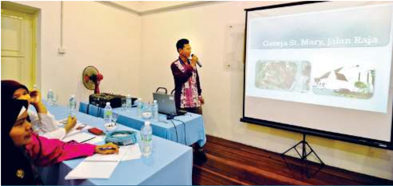
▶ SESI pembentangan kumpulan. Group presentation.

kes. Setiap kumpulan telah memilih bangunan untuk dijadikan sebagai kajian kes dan perlu menyatakan jenis seni bina, istilah, pengaruh, elemen dan sebagainya semasa sesi pembentangan.