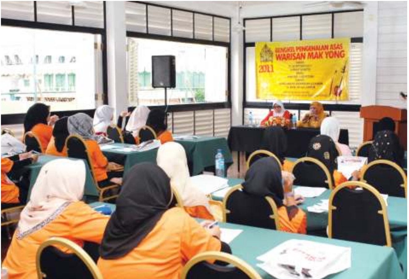
► TEKUNŌ Peserta mendengar ceramah pada bengkel tersebut. Participants listening intently to the workshop speakers.