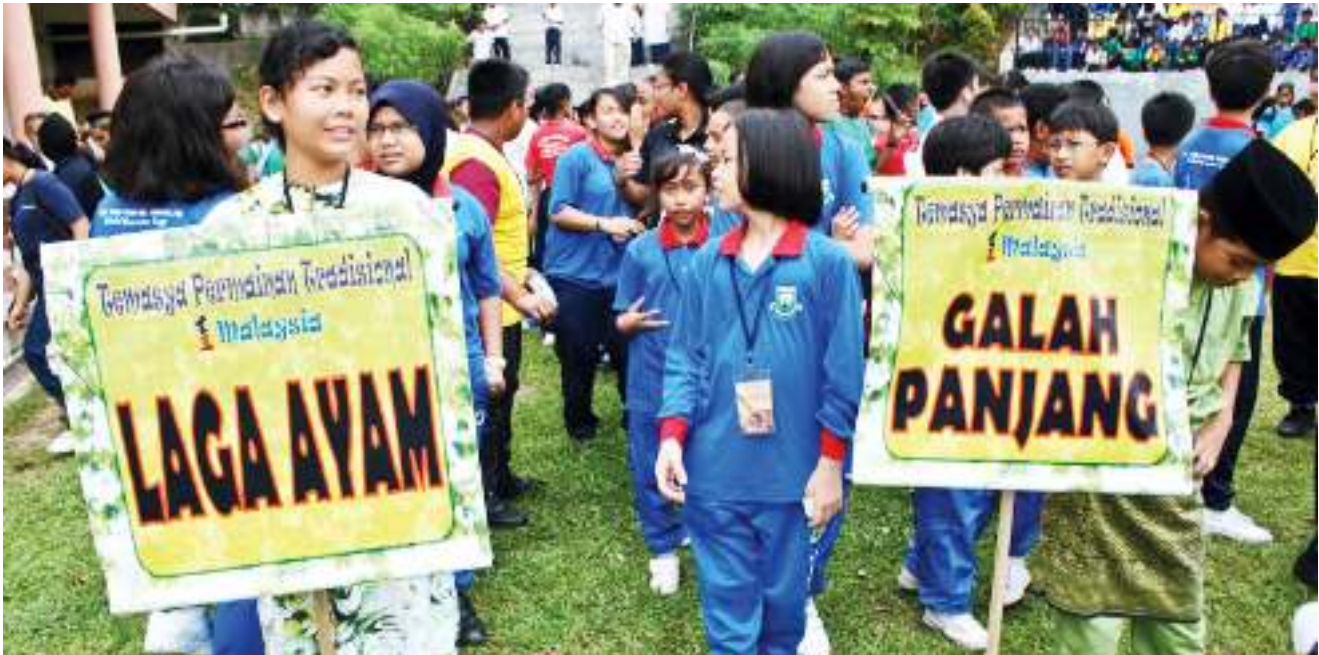
▶ PESERTA permainan tradisi yang terdiri daripada pelbagai bangsa berbaris sebagai acara masuk padang. Multiracial participants lining up in formation at the start of the games.