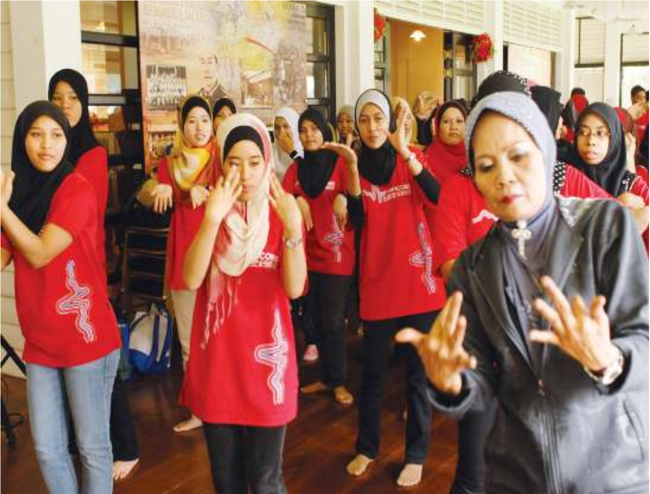
▶ LATIHAN praktikal tarian Mak Yong. Practical training on Mak Yong dance.