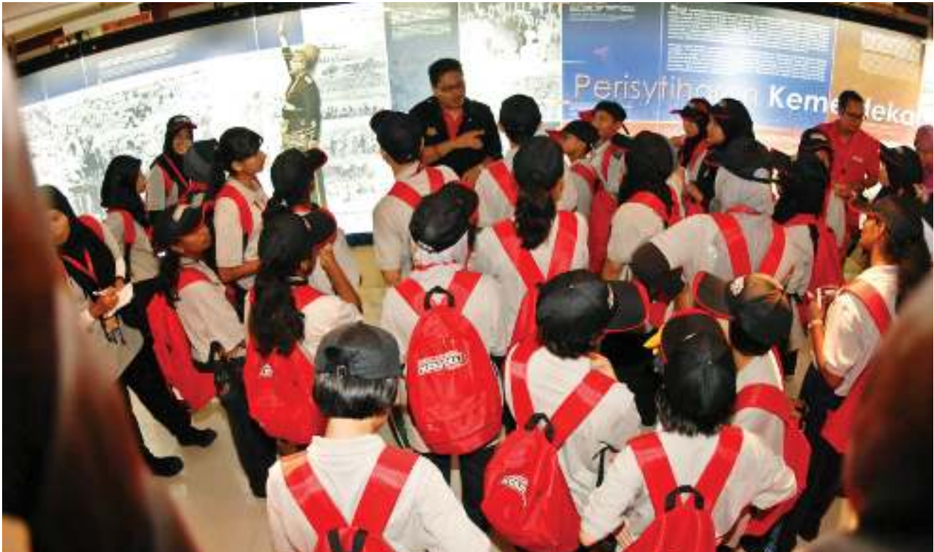
► TEKUN... Para pelajar mendengar penerangan dari wakil di Memorial Tunku Abdul Rahman. Students paying close attention to the briefing by the Tunku Abdul Rahman Memorial's representative.