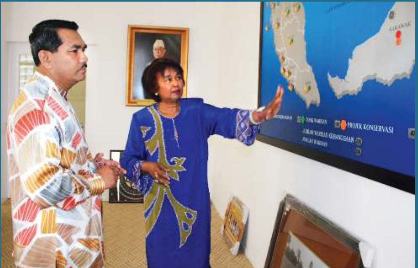
KETUA Pengarah JWN menerangkan sesuatu kepada Timbalan Ketua Setiausaha (K).