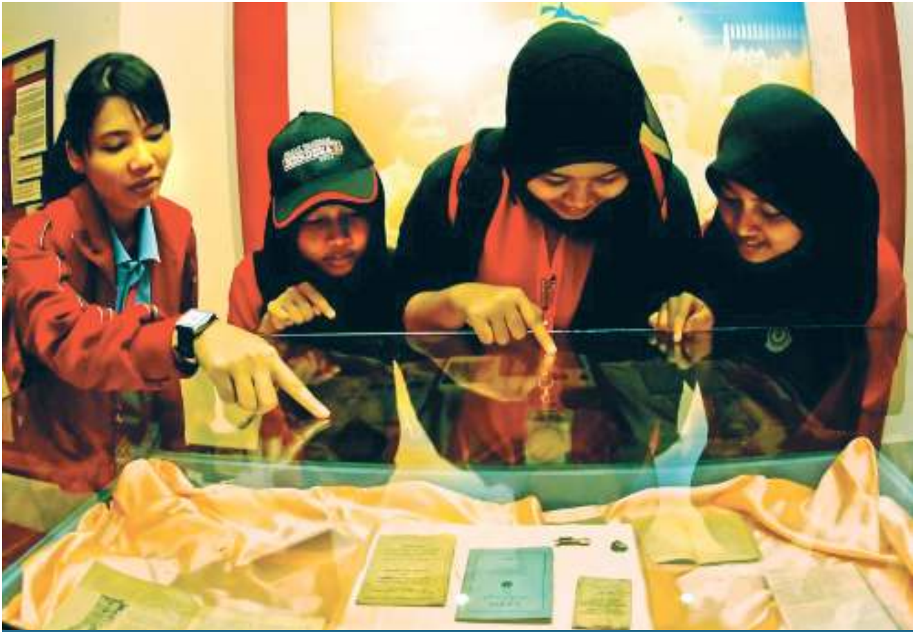
▶ PESERTA diberi penerangan oleh pegawai pengiring. Participant being briefed by the attending officer.