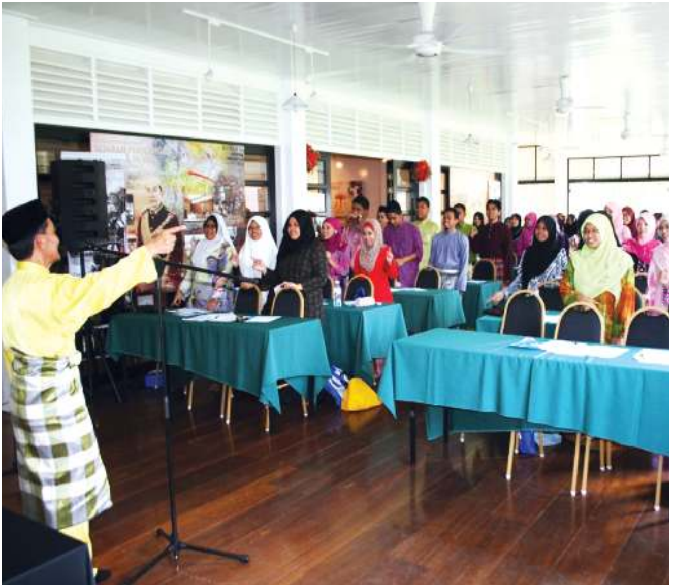
► CERIA peserta menjalani bengkel dengan penuh bersemangat. Participants in high spirits, enjoying the workshop.