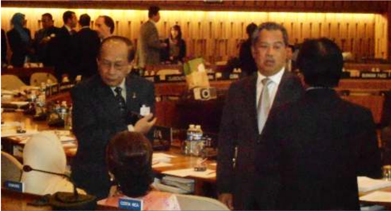
► KEJAYAAN Malaysia juga merupakan hasil usaha meraih sokongan di peringkat antarabangsa yang diterajui oleh Timbalan Perdana Menteri dan Menteri Penerangan Komunikasi dan Kebudayaan. Malaysia's success is also attributed to the efforts led by the Deputy Prime Minister and the Minister of Information Communications and Culture.

bertanding termasuk Malaysia dan hanya 9 buah negara sahaja yang berjaya mengisi kekosongan kerusi di WHC. Pemilihan keanggotaan WHC diadakan setiap dua tahun sekali semasa Perhimpunan Agung Convention for the Protection of the World Cultural and Natural Heritage (1972) di ibu pejabat UNESCO, Paris.