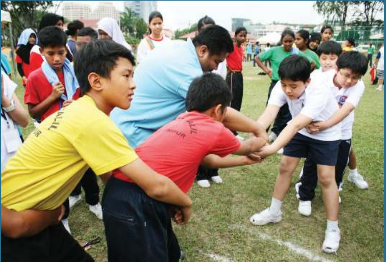
BERSEDIA M urid-murid tidak sabar untuk beradu dalam permainan Rebut Negeri