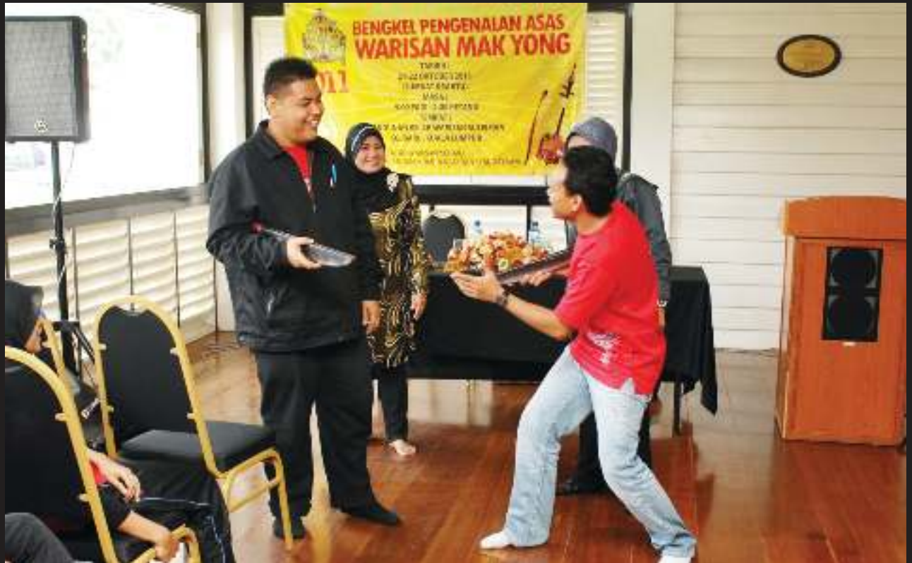
Bengkel Pengenalan Asas Warisan Kebangsaan Mak Yong

PESERTA bengkel diberi tunjuk ajar dalam salah satu babak tarian Mak Yong.