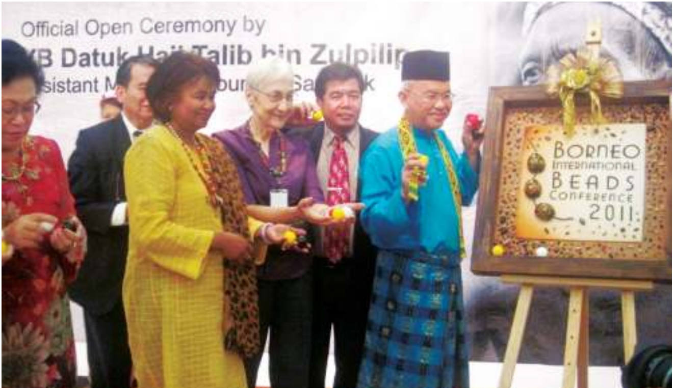
► YB Datuk Haji Talib bin Zulpilip, Timbalan Menteri Pelancongan Sarawak merasmikan Seminar 2nd Borneo International Beads (Bibco) 'Beads and Heritage'. Deputy Minister of Tourism Sarawak, YB Datuk Haji Talib bin Zulpilip officiating the 2nd Borneo International Beads (Bibco) 'Beads and Heritage' Seminar.