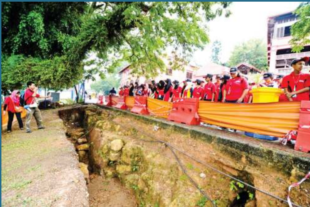
PARA pelajar diberi taklimat di tapak ekskavasi arkeologi di Melaka.