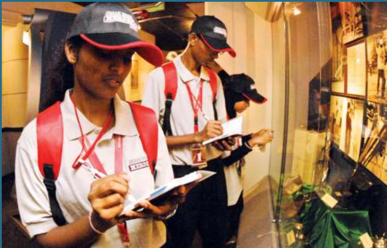
TEKUNÖ P eserta Jejak Warisan menyalin nota sebagai rujukan.