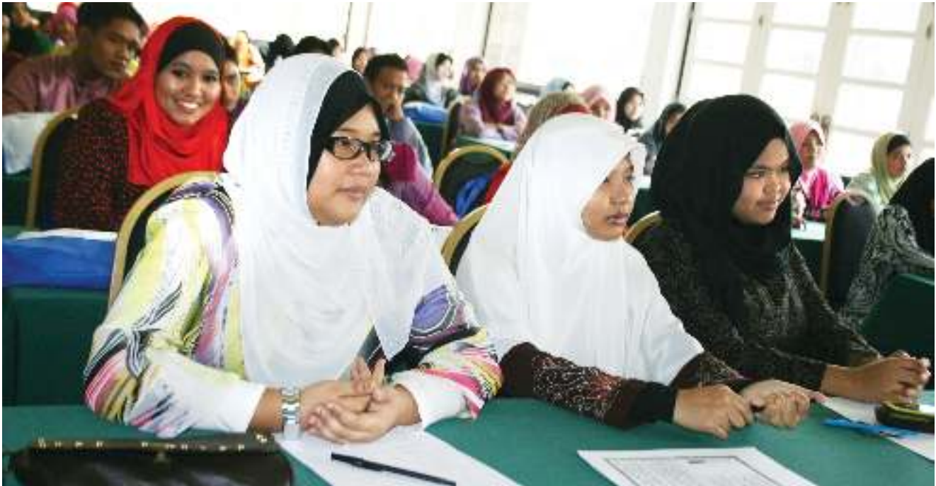
▶ PESERTA memberi tumpuan pada bengkel yang sedang berlangsung. Participants giving full attention during the session.