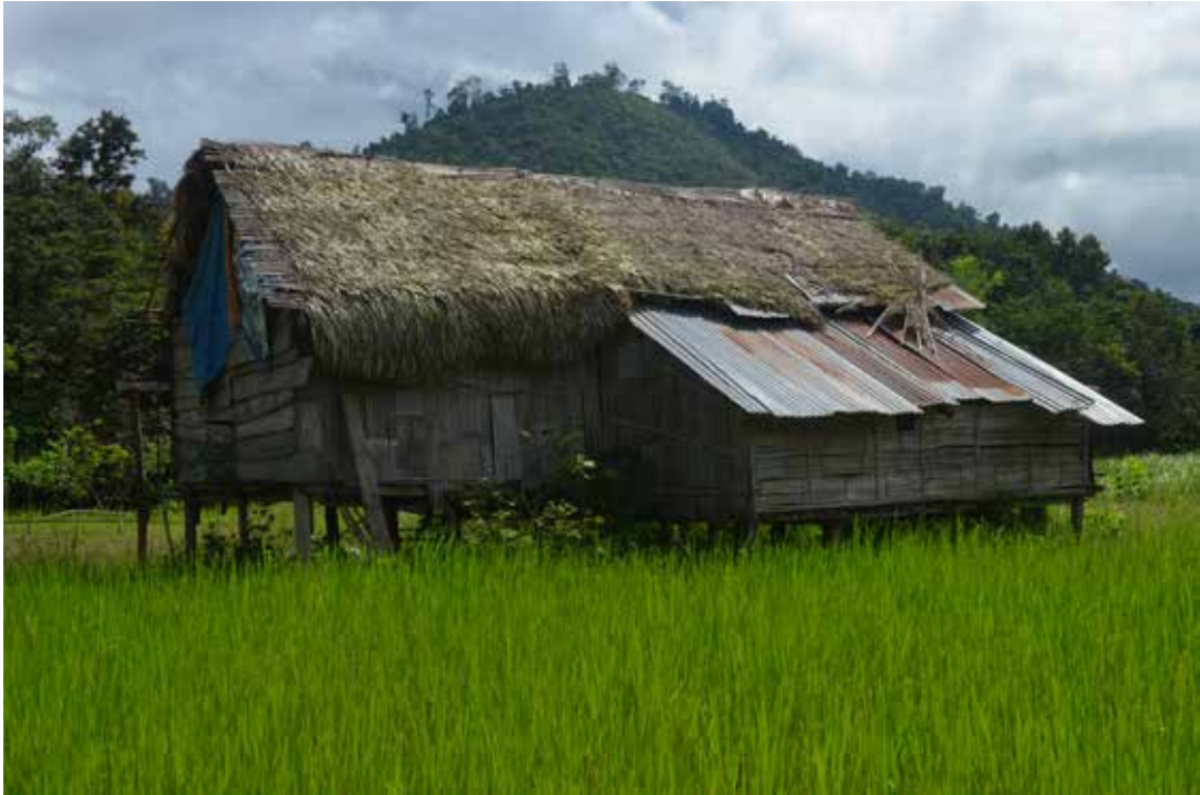
Rajah 3 Bangsal di tengah sawah padi untuk menyimpan alatan untuk pertanian.

Semasa tuaian pertama dilakukan puyang akan datang ke setiap sawah padi untuk upacara menjampi. Bahan yang perlu ada dalam upacara ini ialah beberapa tangkai padi yang telah ditanggalkan. Kemudian goreng dan tumbuk dan dibuat emping untuk dijampi oleh puyang.