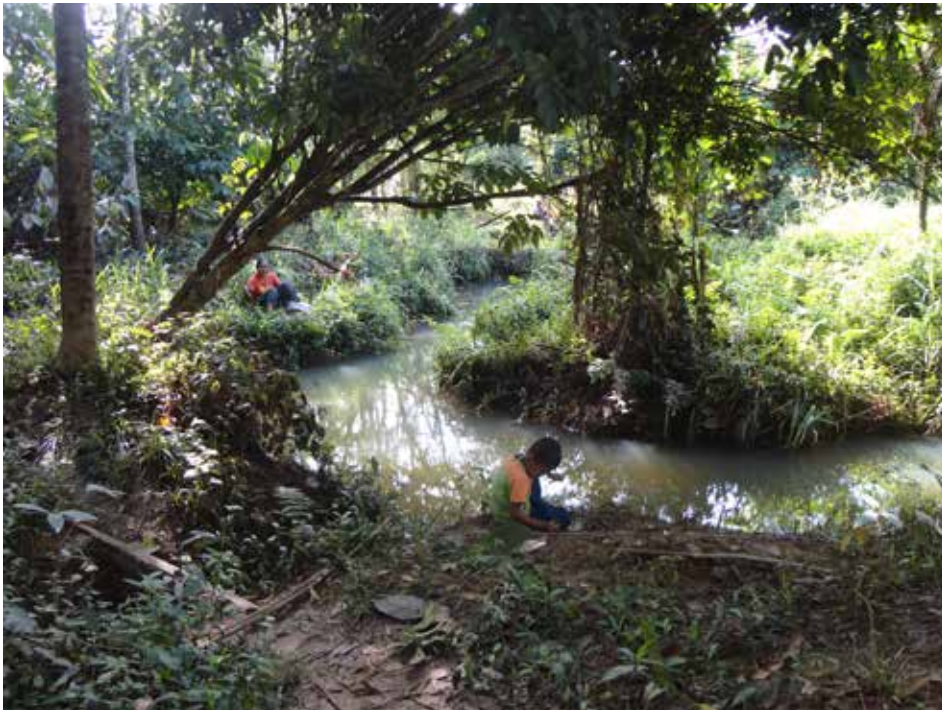
Rajah 4 Kegiatan mengail ikan di anak sungai.

diperbuat daripada kulit pokok kepong, lantai diperbuat daripada buluh. Atap pula diperbuat daripada bertam atau cucuh. Kebanyakan rumah di kampung Pian sudah berubah kepada rumah batu dan beratap zink. Balai adat pula merupakan tempat kaum Jahut melakukan aktiviti dan acara secara beramai-ramai. Contohnya, kenduri-kendara, mesyuarat, sewang dan lain-lain lagi.