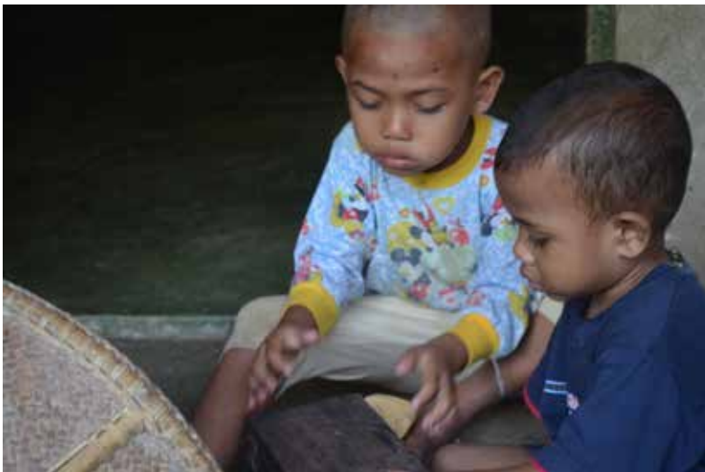
Rajah 2 Kanak-kanak orang Jahut melihat alatan tradisional pertanian.

Setelah beberapa tahun menuntut ilmu, lelaki itu berkahwin dengan anak batin berkenaan. Hasil perkahwinannya, dia dianugerahkan seorang anak lelaki. Lelaki berkenaan meminta izin bapa mentuanya untuk mengadakan majlis bersunat kerana dalam kaumnya anak lelaki diwajibkan bersunat. Pada permulaan bapa mentuanya