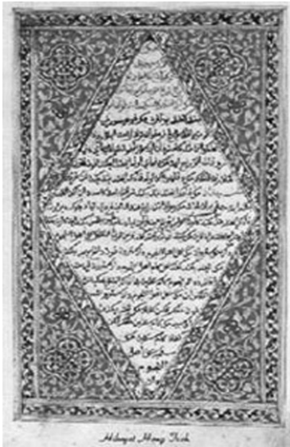
Foto 1. Hikayat Hang Tuah