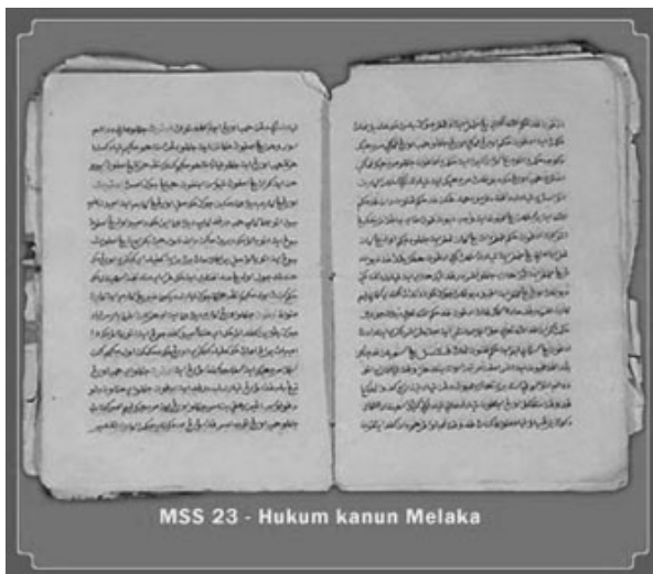
Foto 2. Hukum Kanun Melaka

Dari kepelbagaian kelompok ini, manuskrip keagamaan akan menjadi tumpuan perbincangan, khususnya manuskrip 'Umdat al-Muhtajin ila Suluk Maslak al-Mufradin atau ringkasnya 'Umdat .