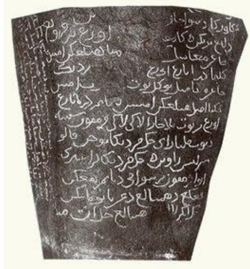
Batu Bersurat Kuala Berang, Terengganu 1303