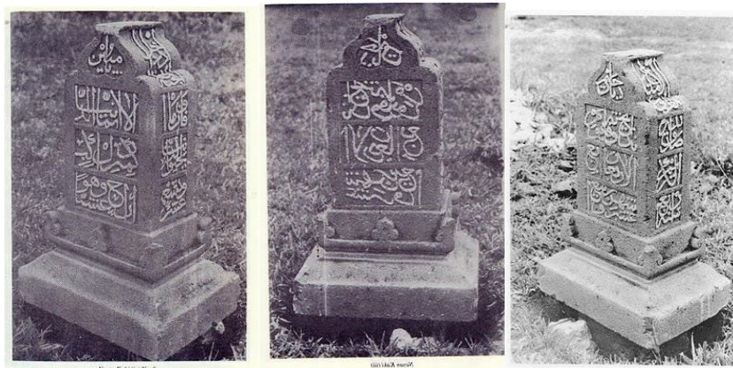
Batu Nisan Permatang Pasir, Pulau Tambun, Pekan, Pahang 1028