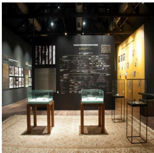
Gambar 6. Galeri Kesultanan Melayu Pahang – Daulat Tuanku di Muzium Sultan Abu Bakar, Pekan, Pahang

Kedua , manfaat daripada pengekal sistem beraja Melayu. Di zaman selepas merdeka, sistem beraja mampu berfungsi sebagai benteng ampuh untuk mempertahankan kedaulatan Melayu-Islam di Malaysia. Terlalu banyak cubaan yang telah diusahakan oleh golongan bukan Melayu dan golongan liberal untuk mencabar kedaulatan Melayu-Islam. Institusi beraja diperlukan untuk membela nasib umat Melayu daripada ancaman tuntutan bukan Melayu.