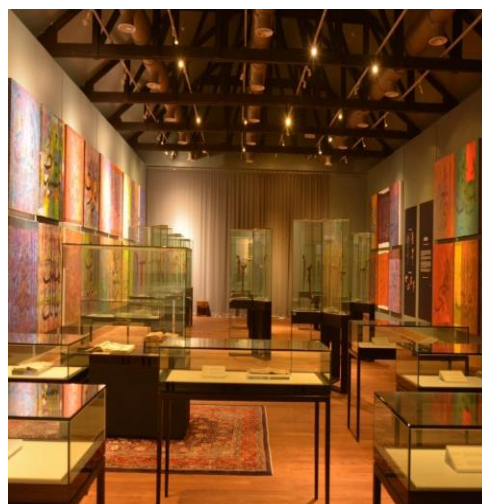
Gambar 7. Galeri Kehambaan di Muzium SABBPP