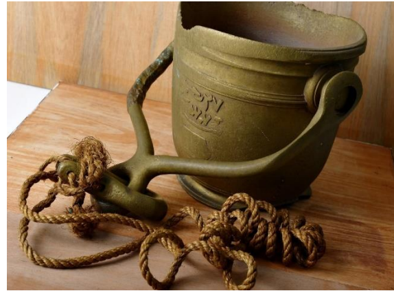
Gambar 2. Timba Tembaga Di Muzium Abu Bakar