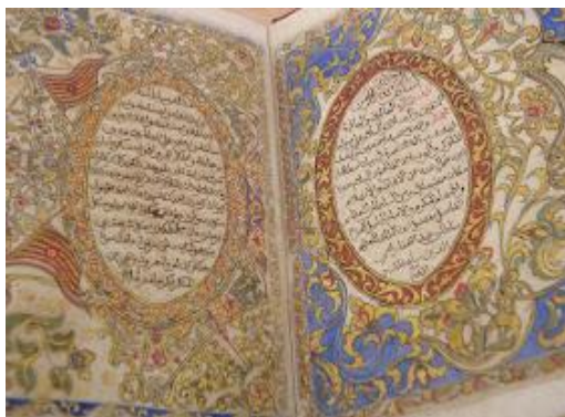
Gambar 3. Teks Hukum Kanun Pahang

Dalam konteks perundangan, masyarakat Melayu memahami norma undang-undang yang bertujuan menyusun hidup bermasyarakat yang sistematik. Ini menunjukkan bahawa asas kefahaman Islam itu perlu menggunakan tiga domain utama dalam kehidupan iaitu pemikiran (kognitif), pembentukan sikap (afektif) dan juga kemahiran yang terhasil (psikomoto). Islam bukan hanya perlu diimani dan difahami, malah ia perlu dipraktikkan dalam kehidupan seharian. Perkara utama adalah Islam juga memerlukan kepada peranan kuasa politik untuk tujuan fungsional pelaksanaan hukumnya dalam kehidupan masyarakat. Menurut Rahimin Affandi (2010), buktinya dapat dilihat kepada artifak Batu Bersurat di Terenggan dan Rahimin Affandi, Ruzman & Nor Adina (2011) menambah keperluan kepada HKP yang mencatatkan peranan fungsional kerajaan diperlukan sejak awal di Alam Melayu.