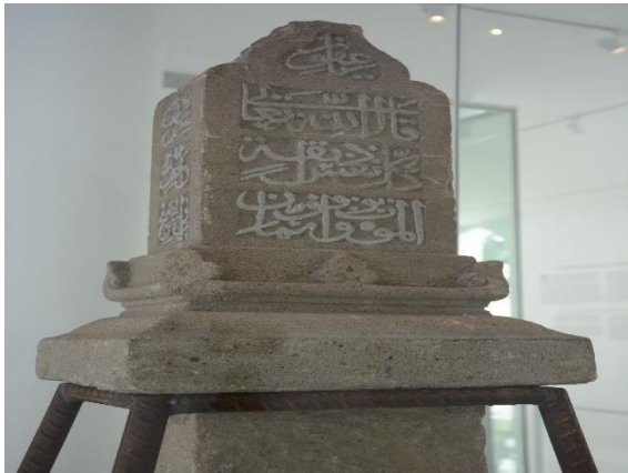
Gambar 1. Batu Nisan di Kampung Pekan Pahang Permatang Pasir, Pulau Tambun, Pekan bertarikh 1028 Masihi.

Kedua jenis artifak ini membuktikan bahawa Pahang telah dijadikan kawasan tumpuan penghijrahan golongan Ahl al-Bayt daripada Timur Tengah. Menurut W. Linehan (1936), orang Arab ini telah menetap di Pahang khususnya di Pekan sebelum abad ke-15, iaitu sebelum terbentuknya Kesultanan Melayu Melaka. Hal ini kerana menurut beliau terdapat banyak makam Syed yang terdapat di Pekan. Malah sehingga hari ini masih terdapat perkampungan masyarakat Arab di Pekan yang didiami oleh waris-waris masyarakat Arab ini secara turun-temurun.