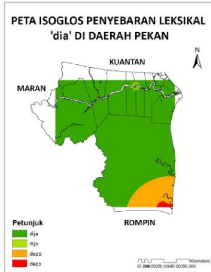
Peta 4 Peta isoglos penyebaran leksikal /kamu/ di Daerah Pekan