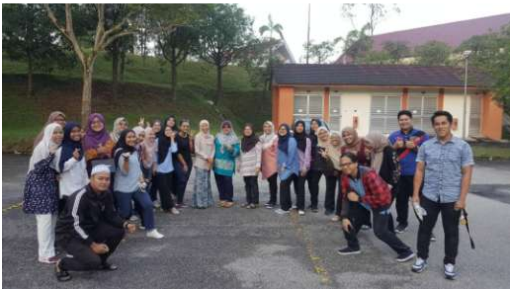
Gambar 1 Penyelidik bersama-sama Penyelidik

Kajian lapangan yang dilakukan melibatkan temu bual, soal selidik dan rakaman audio. Kajian ini melibatkan 150 responden yang terdiri daripada beberapa peringkat umur, iaitu remaja (15-25 tahun), dewasa (26-55 tahun) dan warga emas (56 tahun ke atas) dengan tiga orang penyelidik yang dibantu oleh 26 orang pembantu penyelidik (enumerator).