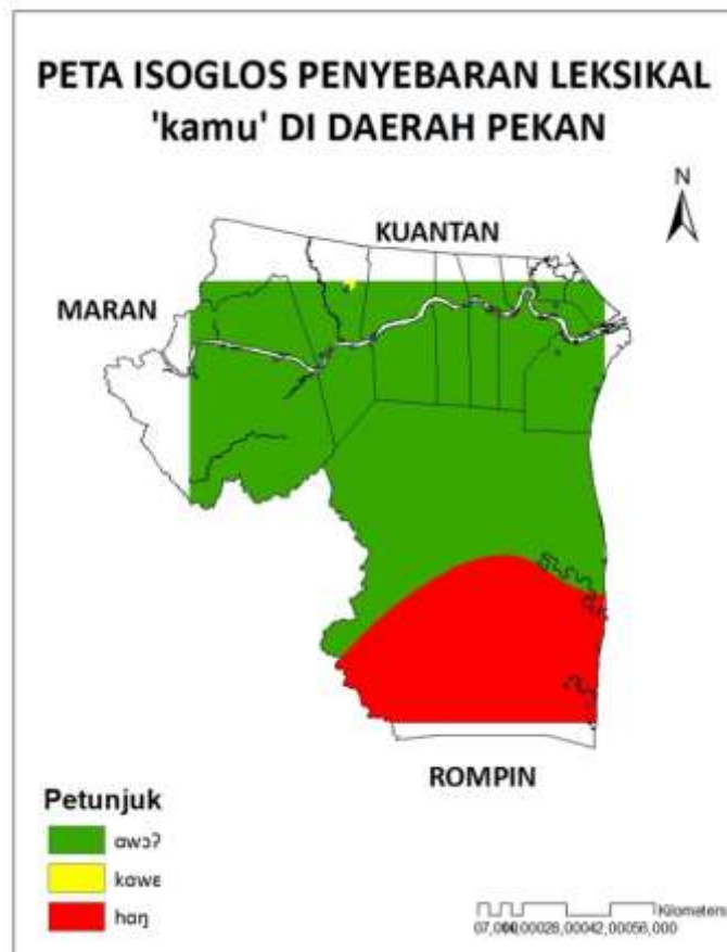
Peta 3 Peta isoglos penyebaran leksikal /kamu/ di Daerah Pekan

Apabila peta isoglos dijana, maka taburan tersebut dapat dilihat dengan lebih jelas seperti yang terpapar dalam Peta 3.