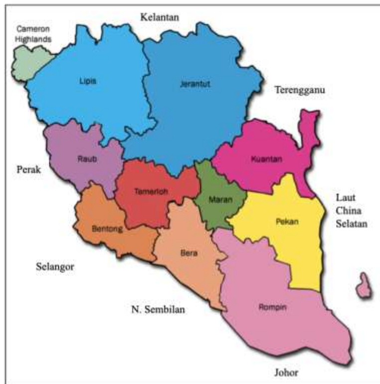
Peta 1 Daerah dan Persempadan Negeri Pahang (Disesuaikan dari sumber Google.com)

Besar dan utara sampai ke Terengganu. Sempadan baratnya pula sampai ke Rembau, Selangor dan Perak (Abd Jalil Borhan 2010). Berdasarkan catatan pengarang China, negeri Pahang dikatakan mempunyai pelbagai nama, seperti Pang-Hang, Peng-Heng, Pang-Heng, Pong-Hong, Phe-Hang, dan Pang-Kang. Orang Arab dan orang Eropah pula menyebutnya sebagai Pam, Pan, Phang, Phaen, Fanhan, Phang dan Pahagh ( https://jpnpahang.moe.gov.my ). Sebelum kedatangan Inggeris, pusat pentadbiran negeri Pahang ialah di Pekan, tetapi kemudiannya dipindahkan ke Lipis. Pada tahun 1955 pusat pentadbiran tersebut berpindah ke Kuantan pula. Sistem perhubungan utama di Pahang pada masa lalu adalah melalui sungai-sungai seperti, Sungai Pahang, Sungai Kuantan, Sungai Bebar, Sungai Rompin, Sungai Endau, Sungai Tembeling, Sungai Jelai, Sungai Semantan dan cawangan-cawangannya. Orang yang hendak pergi ke Kelantan, hendaklah mengikut Sungai Tanum anak Sungai Jelai atau menyusuri Sungat Sat dan Sungai Sepia. Laluan perhubungan ke Perak pula adalah melalui jalan-jalan yang lebih sukar, iaitu mengikut Sungai Bertam dan Sungai Lipis. Seterusnya, untuk ke Selangor laluan yang diikuti adalah dengan menyusuri Sungai Semantan dan cawangannya. Pola sistem pengangkutan pada ketika itu sudah tentu turut meninggalkan kesan pada penduduk, baik dari segi budaya mahupun bahasa.